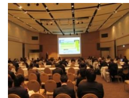
マッチングフォーラム