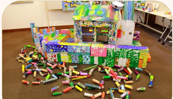
「さんさんおひさま ふねのたび マリンマリン展」