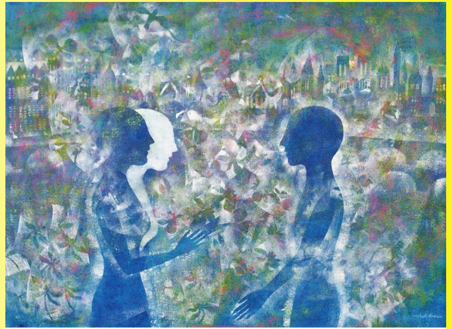
(桑名正子) アクリル F40

パリで生活すること40年 ひたすら絵画の道を追求し 「イメージから生まれる 色彩の世界」を世に問う 桑名正子絵画展開催!