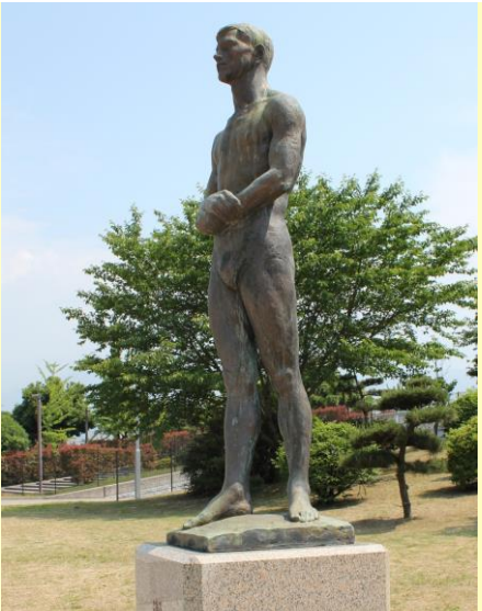
≪ 瀬戸の海 ≫ 1970年(昭和45年)制作 第2回改組日展に出品。 西条運動公園に設置