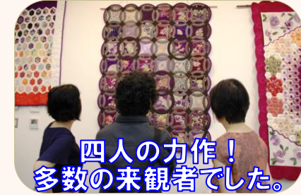
四人の力作! 多数の来観者でした。